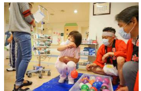
ヨーヨー吊りコーナー