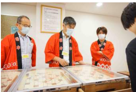
スマートボールコーナー