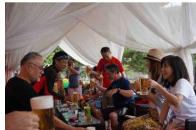
まだまだ呑みます!