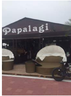
例会会場 オシャレです!!