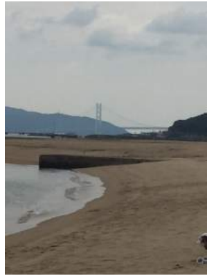
到着!! 台風接近で誰もいない海!