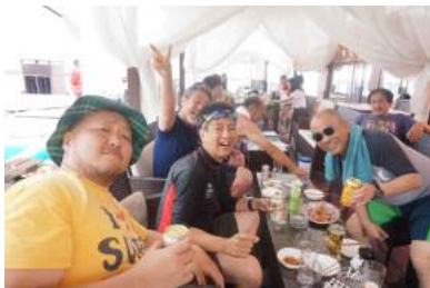
だいぶヨッパライ!!