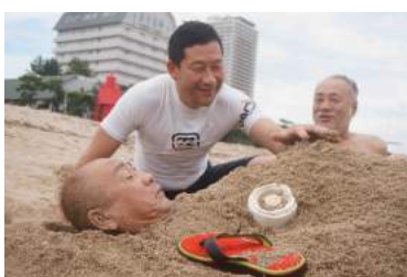
某次々期お偉いさん! イジラれてます