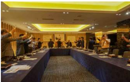
期首恒例! シャンパンで乾杯!!