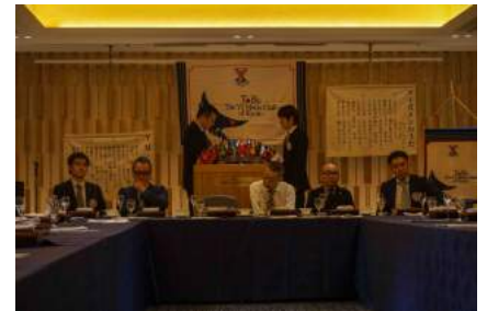
馬場西日本区 LD 委員委嘱状伝達